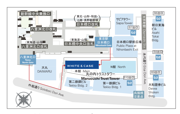
徒歩でのアクセスマップ Walking Access Map