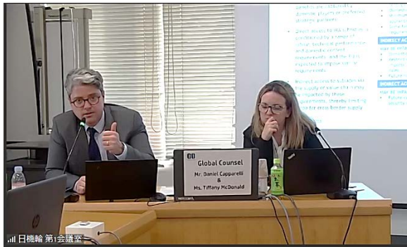
通商セミナーにおける専門家の講演 (1)