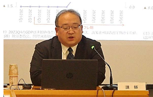
通商セミナーにおける専門家の講演 (2)