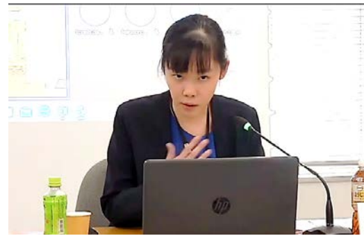
通商委員会における専門家の講演 (1)