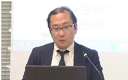
通商委員会における専門家の講演 (2)